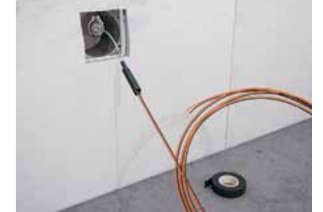
3b Pripojte do siete