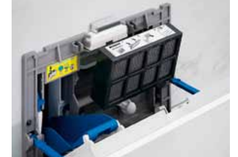
3d Vložte filter s aktívnym uhlím