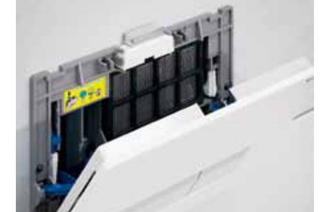
3e Uzavrite tlačidlo – hotovo!

Viac o inštalácii Geberit DuoFresh sa dozviete na