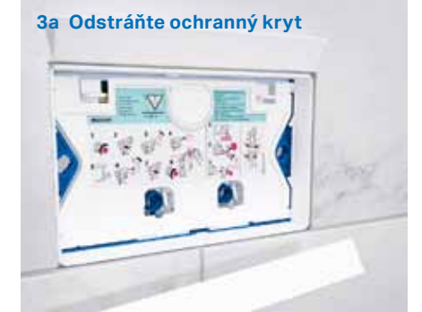
3a Odstráňte ochranný kryt