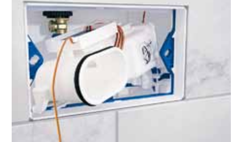
3c Vložte jednotku odsávania zápachu