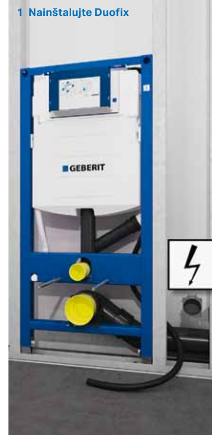
1 Nainštalujte Duofix

Nastavte splachovaciu nádržku ako obvyčajne a potom vložte priloženú jednotku odsávania zápachu a pripojte ju do siete. Pripevnite ovládacie tlačidlo splachovania Sigma40 a vložte filter. Geberit DuoFresh je pripravený na použitie.