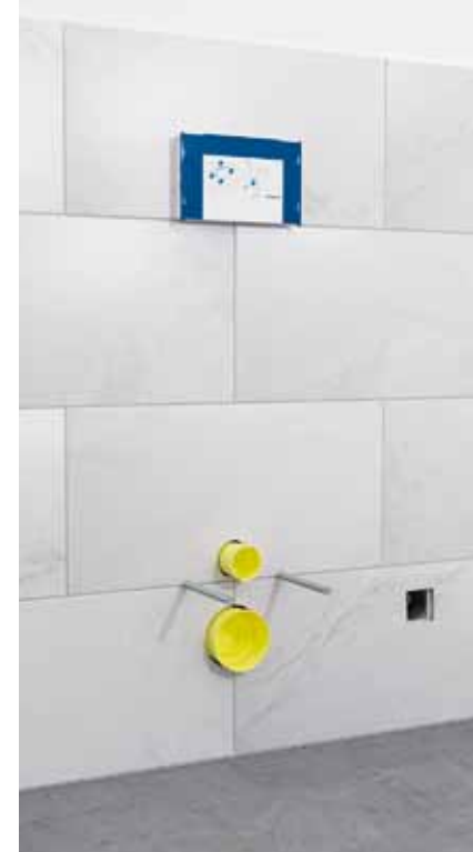
2 Položte obklady